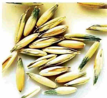
Granos de avena verdes