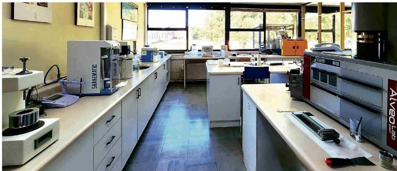
Laboratorio Calidad de trigo

Tiraje: 36.000 Lectoría: 108.300 Favorabilidad: No Definida