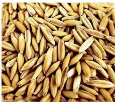
Avena para análisis de arbitraje