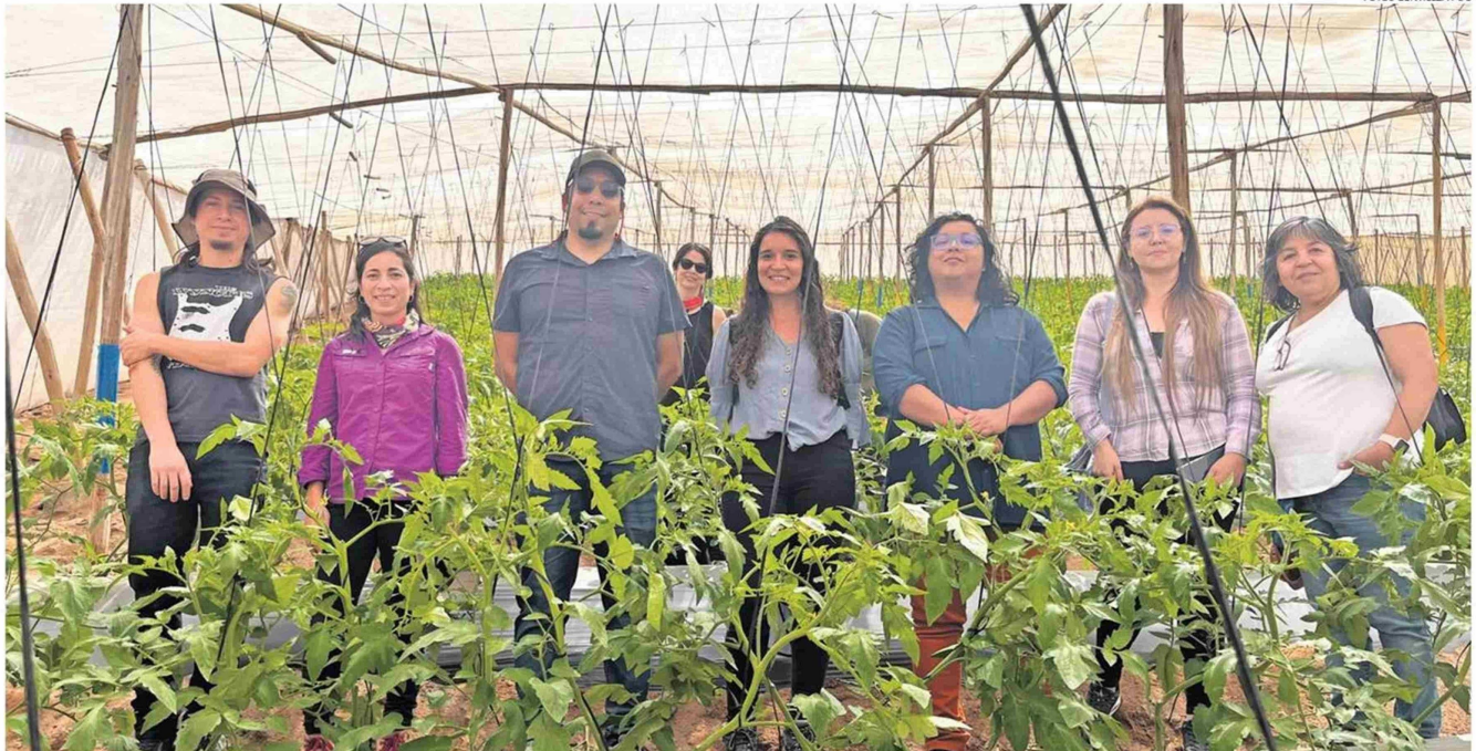
ESTÁN INVESTIGANDO LAS ENFERMEDADES VIRALES EMERGENTES QUE HACE CUATRO AÑOS COMENZARON A AFECTAR LA PRODUCCIÓN DE PIMENTONES, TOMATES, AJÍ Y OTRAS SOLANÁCEAS EN LA REGIÓN.