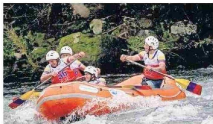
MUNICIPALIDAD DE PUCÓN