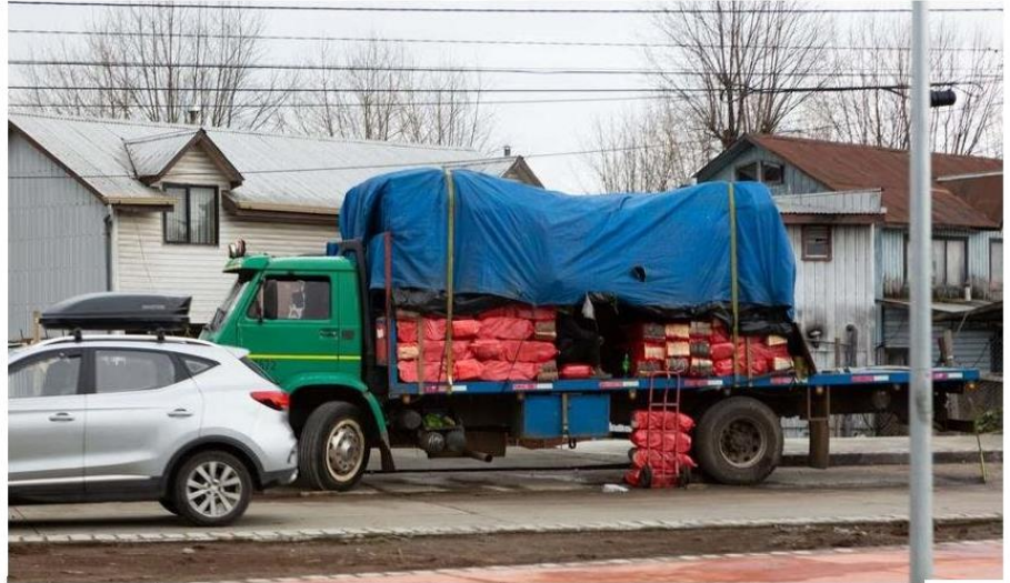
LA SEREMI DE ENERGÍA EXPLICA QUE HAN REALIZADO UNA SERIE DE FISCALIZACIONES A LOS CAMIONES QUE COMERCIALIZAN LEÑA.

Entonces, comenta, que una parte de lo que se extrae de dicha tala se consume en