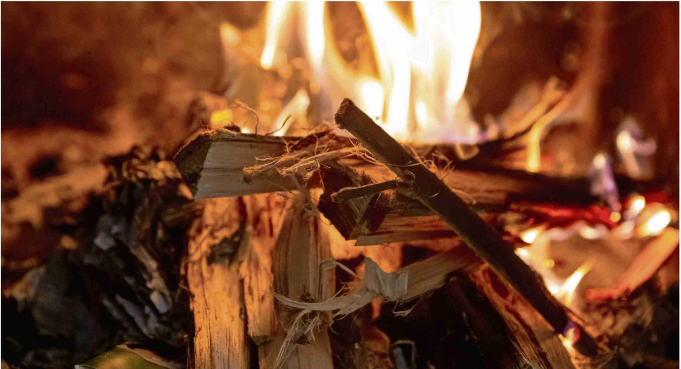
DOS MILLONES 490 MIL METROS CÚBICOS DE LEÑA SE UTILIZAN AL AÑO EN LA REGIÓN, SEGÚN ESTUDIO.