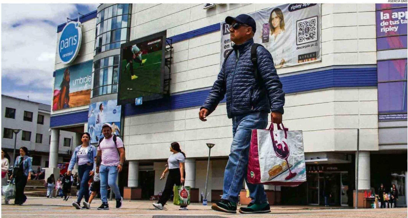
EL MOVIMIENTO DE CONSUMIDORES ERA INCESANTE AYER AL MEDIODÍA EN EL CENTRO DE PUERTO MONTT, LA MAYORÍA CON BOLSAS Y COMPRAS VINCULADAS A LAS FIESTAS DE FIN DE AÑO.