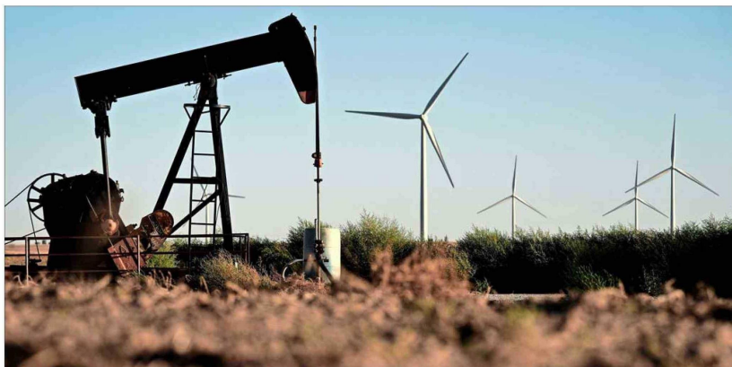
Después de que muchos productores perforaran en exceso hasta la quiebra durante el auge del esquisto, la industria ahora se centra en mantener bajos los costos.

La fijación de Trump con los precios del petróleo es irritante para algunos en la industria. Actualmente, los precios rondan los US$ 73 por barril, un valor relativamente bajo en comparación con 2022, cuando promediaban más de US$ 94 por barril y el precio promedio nacional de la gasolina alcanzó un récord de más de US$ 5 por galón. Los precios de la gasolina promedian US$ 3,10. El