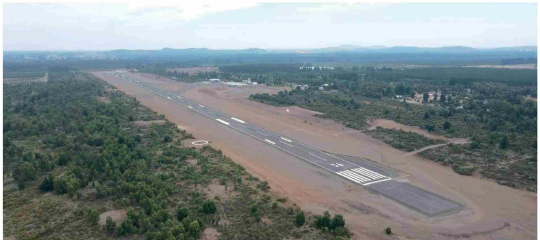
EL AERÓDROMO MARÍA DOLORES tiene una pista de mil 800 metros de longitud por 30 metros de ancho.

A partir del estudio de demanda, que demostró que potencialmente tendría 300 mil pasajeros anuales, el personero consideró que esta ruta "sería atractiva para las aerolíneas, ya que presenta indicadores similares a los de la ruta Santiago-Concepción".