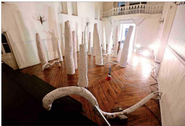
"Un día antes", de Melania Lynch, se presenta en el Centro Cultural Montecarmelo de Providencia.

Una propuesta en torno a la existencia y al hongo prototaxites coincide en agosto con piezas lumínicas vinculadas a lo ancestral. Asimismo, muestras colectivas dan luces de la actualidad y de esculturas esenciales.