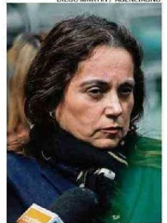
DIEGO MARTIN / AGENCIAUNO