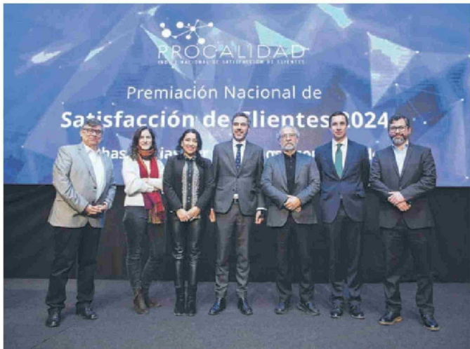
◀ El equipo del Centro de Experiencias y Servicios y autoridades de la Universidad Adolfo Ibáñez.