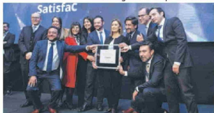
▼ En la categoría Contractual, sector Gas medidor fue distinguida la empresa Gasco.