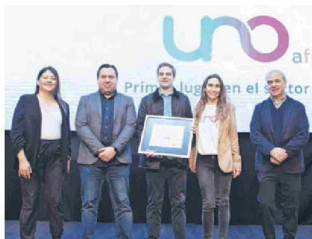
▲ AFP UNO fue galardonada en la categoría Contractual, sector AFP.