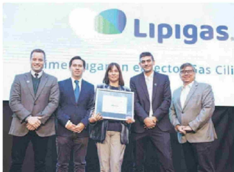
▲ En la categoría Transaccional, sector Gas Cilindro fue distinguida la empresa Lipigas.