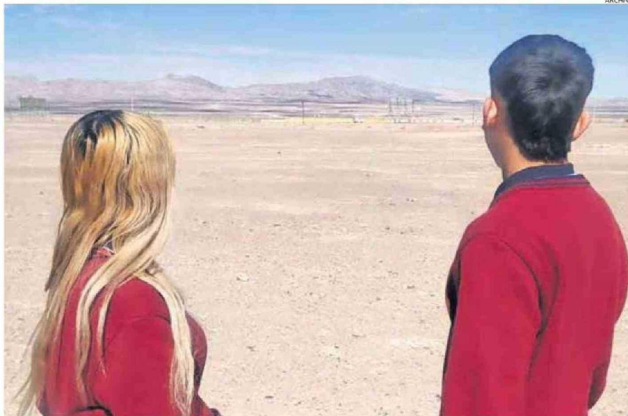
CALAMA CUENTA CON EL TERRENO PARA LA CONSTRUCCIÓN DE LA FUTURA UNIVERSIDAD QUE INCLUYA CARRERAS TRADICIONALES.

Además, de los temas relacionados con la salud, consideró que “por supuesto las carreras