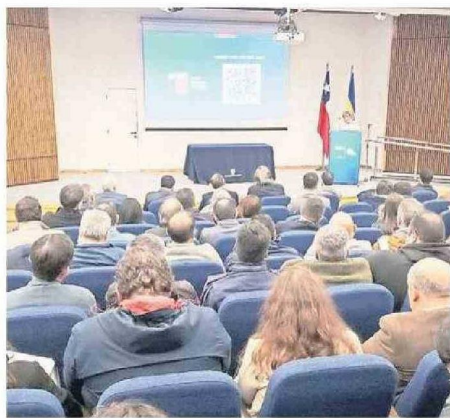
LA MINISTRA DEL MOP, JESSICA LÓPEZ, DURANTE SU INTERVENCIÓN.