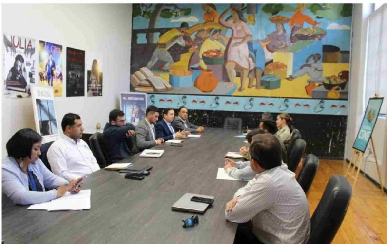
AUTORIDADES, POLICÍAS Y FISCALES participaron de una nueva sesión de la Mesa Técnica Provincial de Robo de Cable, en la que se abordaron medidas para combatir este delito y proteger el suministro eléctrico en la zona.