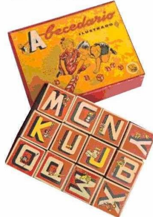
Abecedario de cartulina ilustrada, marca Guau, circa 1968.

El microbús de hojalata es de la famosa marca Neumann S.A., circa 1957. “Yo tengo un lazo afectivo con muchos juguetes, ya sea por su historia, belleza estética o valor patrimonial”, dice Santis.