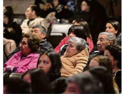
AGrupaciones de la sociedad civil y autoridades académicas participaron en el exitoso seminario realizado en la UCT.