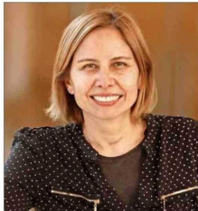
UNIVERSIDAD DE LOS ANDES

IMPACTO. —Las personas de mayor edad necesitan mayores atenciones médicas debido a que existe una mayor prevalencia de enfermedades crónicas, discapacidad y condiciones asociadas al envejecimiento.