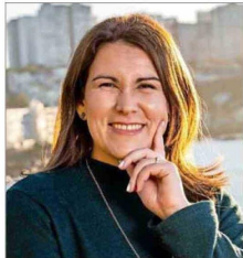
UNIVERSIDAD DE LOS ANDES

“La modalidad de libre elección cubre menos, por tanto el copago es un poco más alto. Lamentablemente el sistema no es perfecto, pero es un costo que debe asumir el afiliado por agilizar atenciones”.