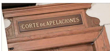
UNÁNIME —La decisión de la Corte de Apelaciones de Santiago se adoptó de manera unánime.

ló los motivos por los cuales procedió de esa forma”. Así, por estas y otras consideraciones, sostienen los jueces, “se rechaza, sin costas, el recurso de protección deducido por Fundación Fuerza Ciudadana contra la Contraloría General de la República”. Si bien, en 2018, el entonces contralor Jorge Bermúdez estableció un criterio mediante el cual se aplicaba la confianza legítima cuando un funcionario cumplía dos años en su puesto, es decir, que podía tener la legítima expectativa de que fuera renovado en su cargo al cabo de ese tiempo; pero, en no-