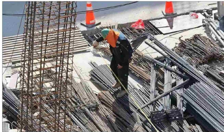
En 2024, el aporte acumulado de la productividad del país al crecimiento económico ha sido de -1,4 puntos porcentuales, según cálculos del centro de estudios.

Para calcular las variaciones de la productividad se requiere conocer la tasa de crecimiento de la economía, el nivel de recursos para producir bienes y servicios (stock de capital), y trabajo. En el tercer trimestre de este año, el PIB aumentó 2,3% anual, mientras el stock de capital subió un 3,9% y el empleo avanzó en 2,4% en igual periodo.