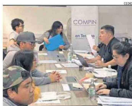
ALUMNOS DE LA F-33 EL CON PERSONAL DE LA COMPIN.