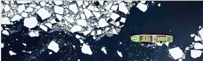
Coordinada por Brasil, la expedición ICCE rodeó la Antártica en el rompehielos ruso "Akademik Tryoshnikov" para recolectar datos glaciológicos, oceanográficos y atmosféricos, así como tomar muestras de masas de hielo costeras. A bordo iban 51 científicos de siete países.