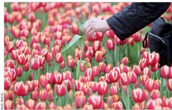
En el "Día del Tulipán" (26 de septiembre) se celebra la llegada de la primavera.

Expertos estiman que ventana de dos meses para traer al país inversiones desde el extranjero es muy acotada. Señalan que se requiere un período de al menos cinco meses. Asimismo, especialistas apuntan que la cifra prevista de ingresos no concuerda con los supuestos en dólares. B 2