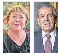
Michelle Bachelet. Eduardo Frei.

NUEVOS NEGOCIOS Theodora AI: la firma detectora de sesgos que crece en México y que se reunió con CEO de Microsoft B 4