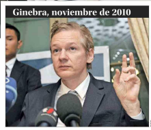
Ginebra, noviembre de 2010

El fundador de WikiLeaks aceptó declararse culpable ante un tribunal estadounidense en el Pacífico, en el marco de un acuerdo que le permitió recuperar la libertad, después de casi 14 años de un proceso por filtrar información clasificada. Se le darían cinco años por el cargo que reconoció y se contabilizarían sus años de prisión en Londres. 4