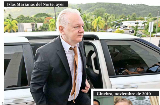
Islas Marianas del Norte, ayer

EL FERROCARRIL, UN ÍTEM FRECUENTE EN LA AGENDA PRESIDENCIAL | 1