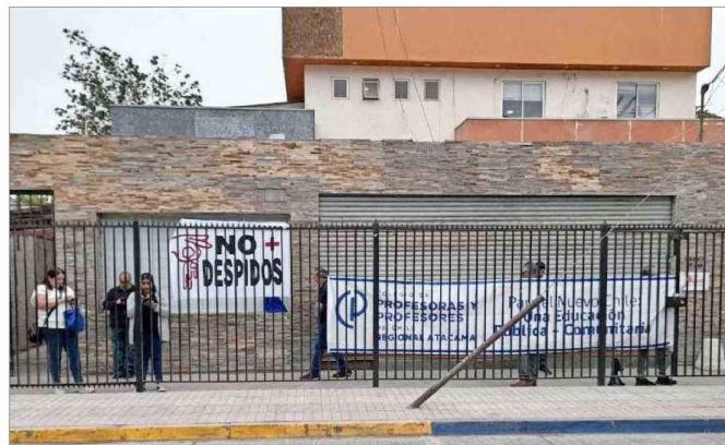
Un informe de Contraloría advierte nuevos problemas en el SLEP de Atacama, según se conoció en los últimos días. Entre otras cosas, menciona que hubo una baja ejecución de los convenios de equipamiento para colegios técnicos profesionales.

más pertinentes hoy, porque después de la pandemia y el estallido algunos problemas de la educación son distintos", apunta el académico, y ejemplifica con que "la deserción escolar y la asistencia a clases, que antes no era tan marcado, ahora es de alta preocupación".