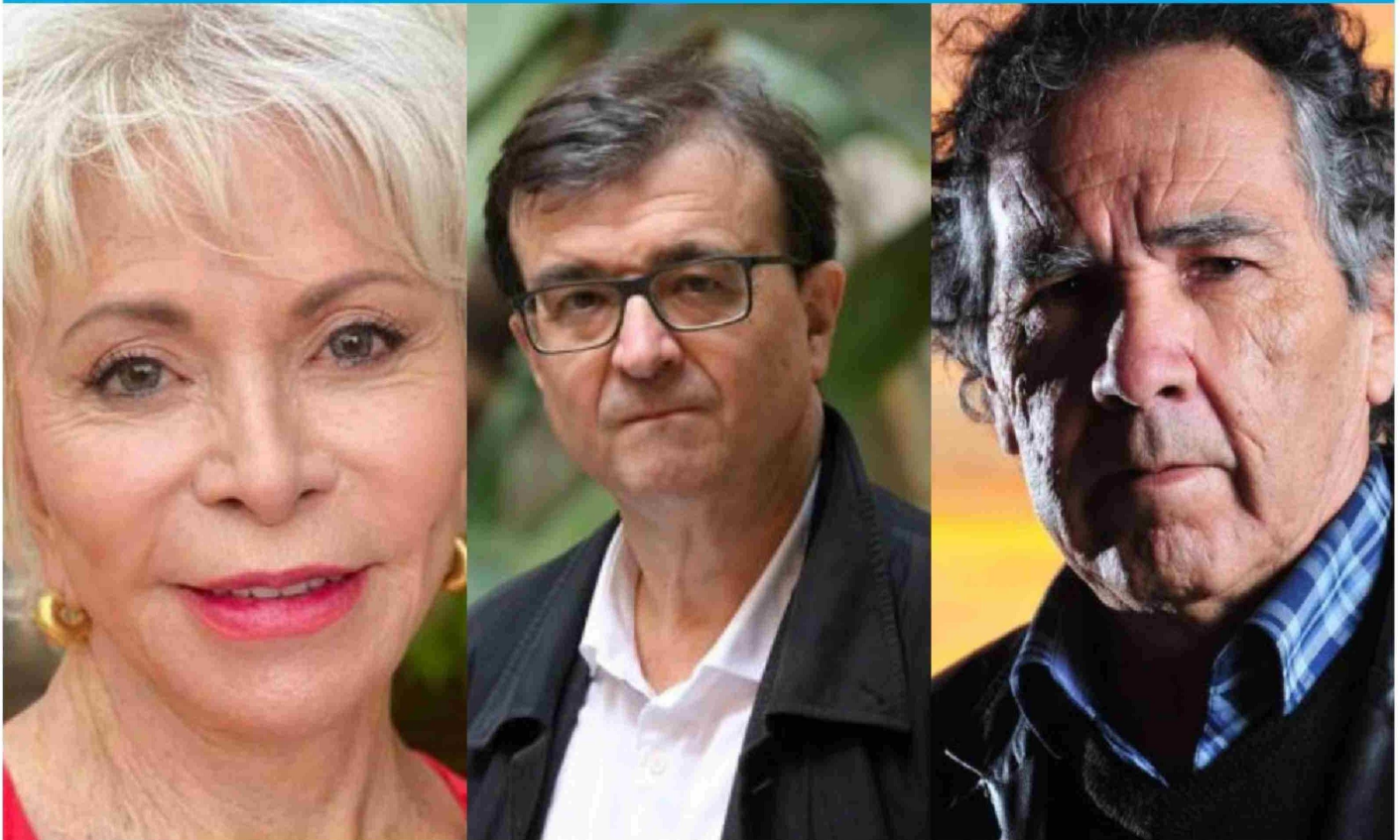
► Los autores nacionales Isabel Allende (izquierda) y Hernán Rivera Letelier (derecha) junto al escritor español Javier Cercas (centro).