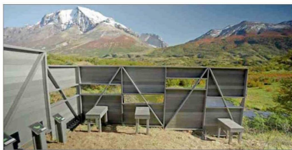
Mirador de aves en Torres del Paine, realizado con la madera plástica de EverWood