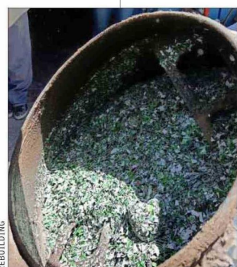
La startup transforma residuos de construcción en hormigón verde.

Rebuilding forma parte del programa "Resiliencia Climática" de Corfo, que le ha permitido fortalecer su tecnología y expandirse a nivel nacional e internacional. Actualmente, la empresa está explorando oportunidades en mercados como Brasil, México, España y Perú, con el objetivo de replicar su modelo de reciclaje territorial en otras ciudades. "Queremos demostrar que la construcción sustentable no es una utopía, sino una necesidad urgente", concluye su fundador.