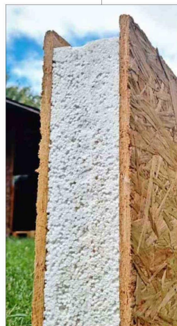
A través de la utilización de desechos de la industria salmonera, fabrican paneles aislantes

La empresa es parte del programa "Resiliencia Climática" de Corfo, ejecutado por IncubatecUFRO, que definen como "clave" para fortalecer su modelo de negocio y ampliar su impacto en la región. Con el financiamiento recibido, esperan escalar su producción y consolidarse como referentes en la economía circular del sur del país.