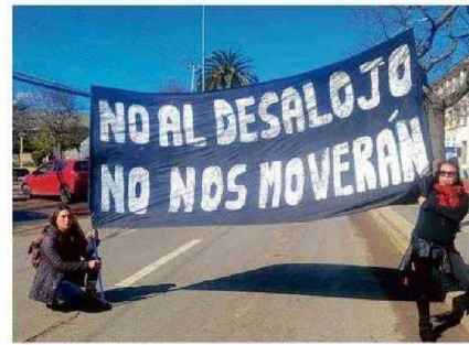
POBLADORES DICEN QUE NO SE ABORDÓ EL DESALOJO.

Ese es su origen y esto representa que sus condiciones de campamento se originan por una crisis en la política habitacional y falta de generación de oportunidades para obtener la vivienda o suelo".