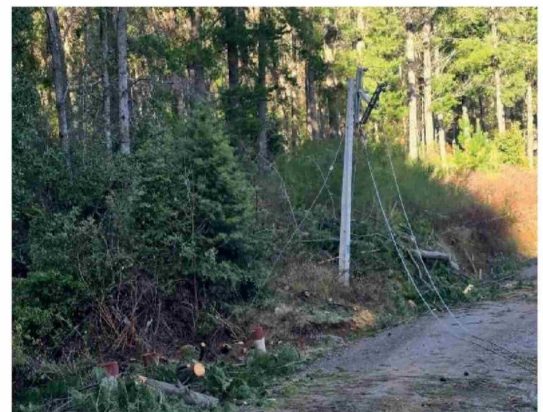
FAMILIAS DE LA LOCALIDAD perdieron toda su reserva alimentaria de la temporada invernal.