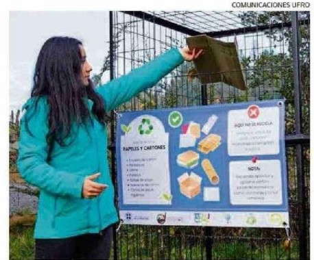
LAS ACCIONES DE ENCUENTRO Y CAPACITACIÓN FUERON CORONADAS CON LA INSTALACIÓN DE DOS PUNTOS LIMPIOS PARA LA COMUNIDAD.