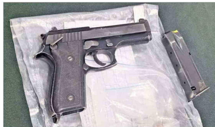
Las pistolas institucionales de las víctimas fueron robadas por los imputados, pero en los allanamientos del lunes fueron recuperadas.