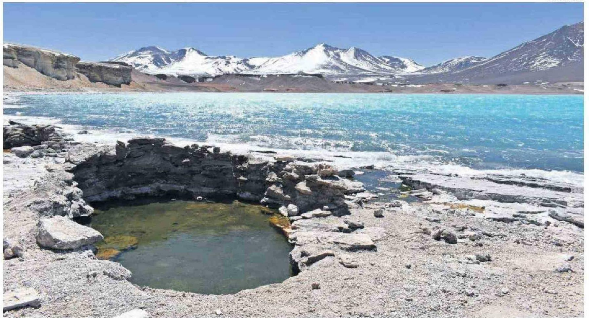
LA EXPOSICIÓN ABORDA LA TRANSICIÓN ENERGÉTICA EN CHILE Y COLOMBIA, INCLUYENDO A LA REGIÓN DE ATACAMA, DONDE SE PROYECTAN FUERTES INVERSIONES POR EL LITIO.