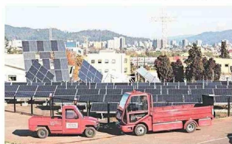
Programas como el Diplomado en Educación Ambiental, Certificación y Sustentabilidad, y Diplomado en Electromovilidad son solo algunos de los 72 ofertados por la casa de estudios superiores.

La innovación, sostenibilidad y energía, son áreas importantes que se abordan en los programas actualmente vigentes.