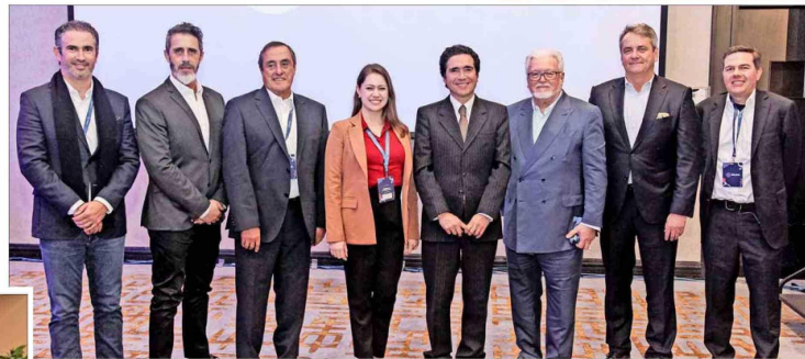
Ejecutivos de All4Labels Global Packaging Group junto a Ignacio Briones.