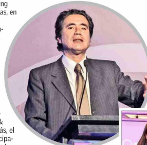
Ignacio Briones , exministro de Hacienda, entregó sus perspectivas sobre la industria del vino en el país y a nivel global.

Durante la reunión, altos ejecutivos de la empresa abordaron las perspectivas corporativas del sector a nivel global, así como las últimas novedades y tendencias en etiquetado de Wine & Spirits en el mercado. Además, el seminario contó con la participación del exministro de Hacienda, Ignacio Briones , quien compartió su visión sobre el escenario geopolítico de la industria a nivel mundial y las perspectivas para la industria del vino en Chile y el mundo.