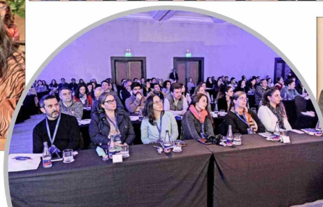
Asistentes al seminario "Hablemos de Etiquetas".