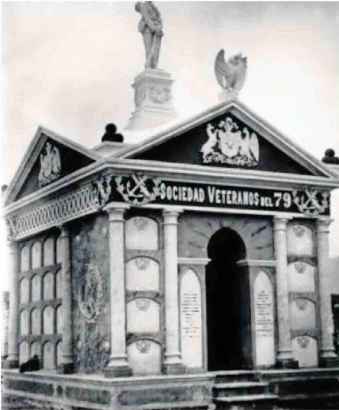
ESTRUCTURA TIENE MÁS DE 120 AÑOS DE HISTORIA