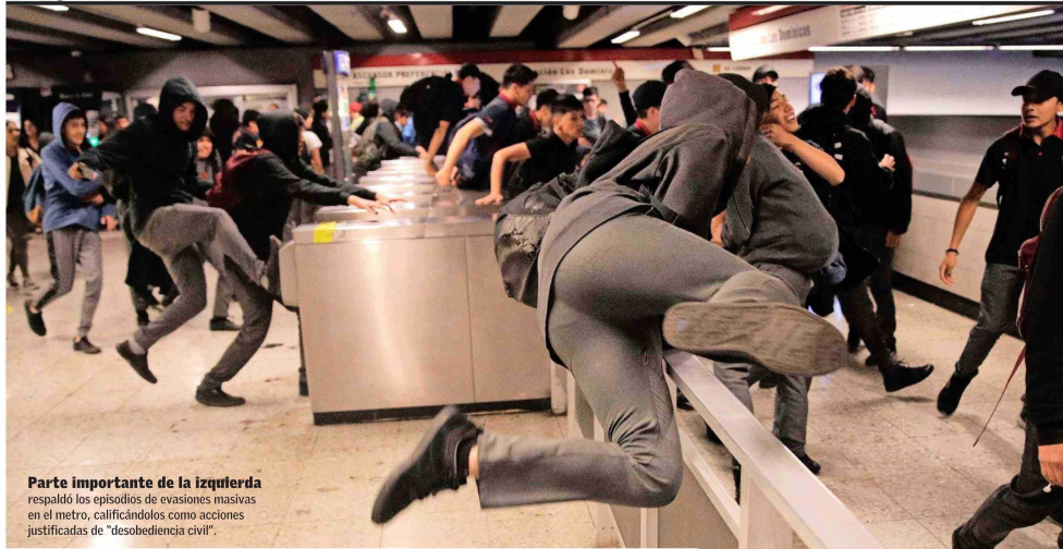
Parte importante de la izquierda respaldó los episodios de evasiones masivas en el metro, calificándolos como acciones justificadas de "desobediencia civil".

DOMINGO 13 DE OCTUBRE DE 2024 EL MERCURIO