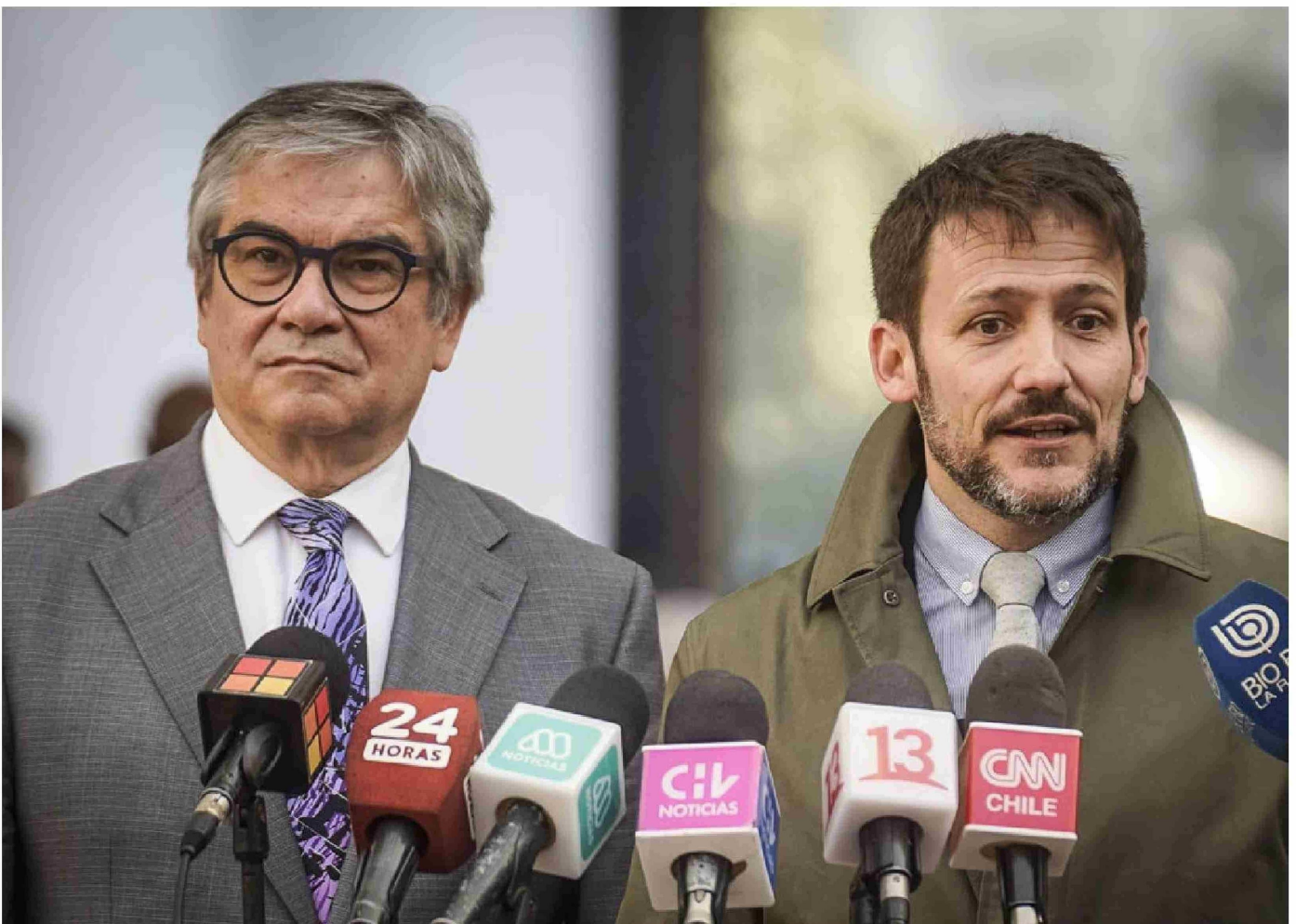
► Mario Marcel y Diego Pardow, ministros de Hacienda y Energía