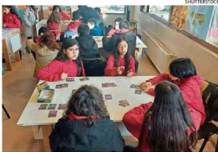
ALUMNOS DEL COLEGIO ALTAMIRA DE COYHAIQUE LO PROBARON.

ñada para dos a seis jugadores, en un circuito que dura entre a 20 a 35 minutos. Se proclama ganador el participante que primero logre reunir cuatro "colecciones".