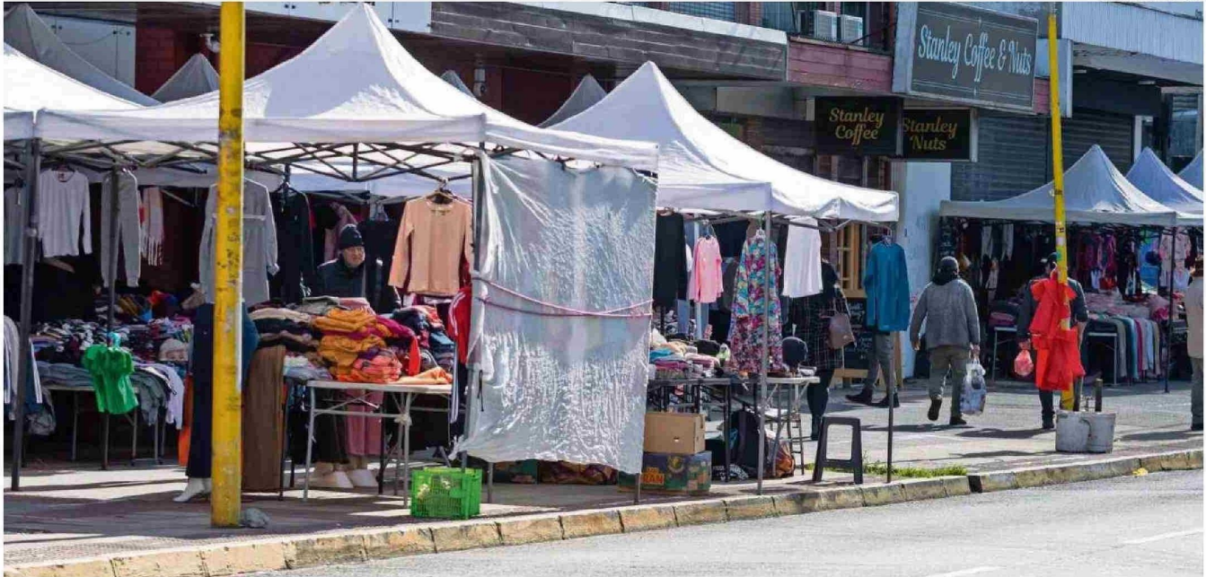
LA ENCUESTA DEFINIÓ QUE UN 43,2% DE LOS COMERCIANTES DE PUERTO MONTT ASEGURÓ QUE AUMENTÓ LA PRESENCIA DE VENDEDORES ILEGALES.

Erwin Schnaidt erwin.schnaidt@diariollanquihue.cl