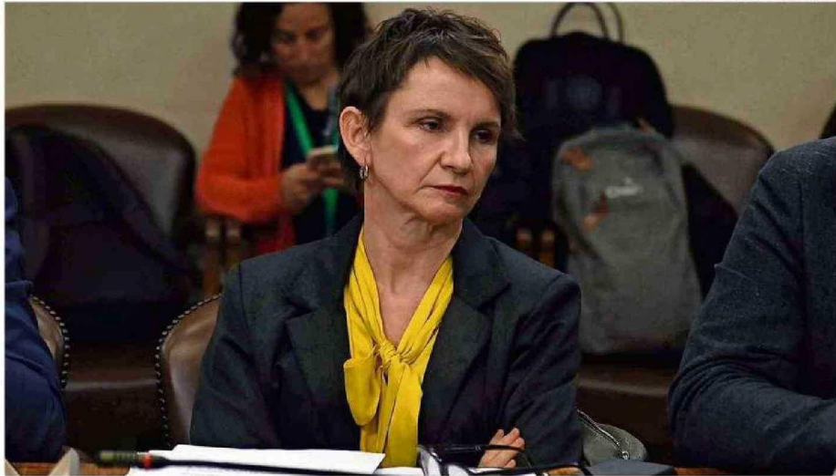
LA MINISTRA DEL INTERIOR ACONSEJÓ “EXTENDER LOS HORARIOS” DE FUNCIONAMIENTO DEL CONGRESO.

“Casos de corrupción permanentemente se están analizando, pero casos de corrupción en donde se mencionaban abogados ligados al Ministerio del Interior, jueces de la Corte Suprema (Ángela Vivanco, Jean Pierre Matus, Sergio Muñoz y Mario Carroza), exministros del Interior (Andrés Chadwick), es de una gravedad mayor, por lo tanto acá cada institución, (...) todos tenemos que hacer nuestra parte”, destacó la secretaria de Estado en