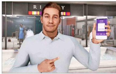
"Lukas", un avatar creado con IA para ofrecer educación financiera "personalizada y accesible".

antes de Chile. "Acá nadie nos pescaba, nos encontraban caros y decían que estábamos locos", relata como anécdota. "Pero acá ya está llegando, por varios lados", analiza y dice que están "metiéndole a full" con este tema, que espera que sea la tendencia de este año.