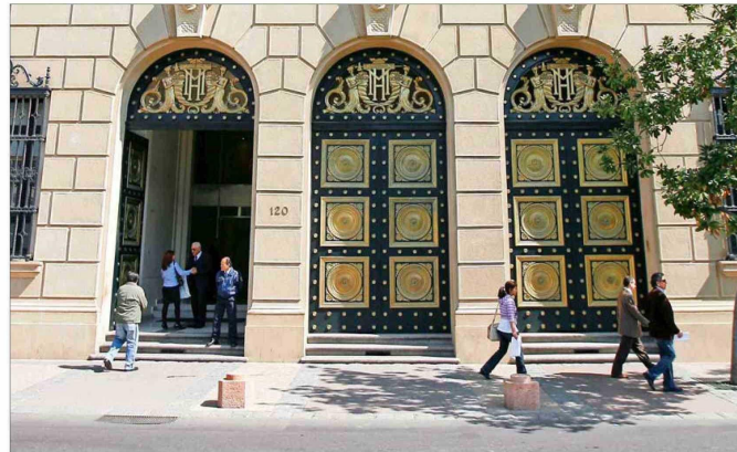
El oficio circular del Ministerio de Hacienda fue dictado a finales de mayo.

El oficio de Teatinos 120, sede del Ministerio de Hacienda, explica que el cálculo para determinar el tope de 1% real en el costo de los nuevos contratos deberá efectuarse considerando la planilla correspondiente al mes anterior del vencimiento del contrato colectivo vigente, "y no se po-