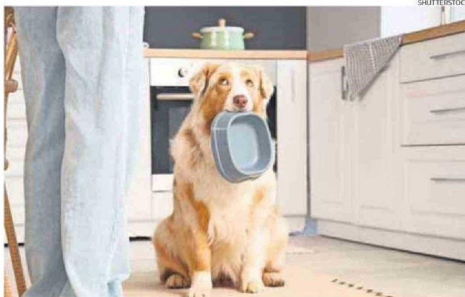
LOS PLATOS DE COMIDA ALOJAN MICROORGANISMOS Y RESIDUOS.