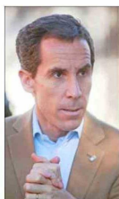
Alcalde de Lo Barnechea, Felipe Alessandri.

Explica que el “principal problema es el acceso, es demasiado peligroso”, recalcando la urgencia de una solución definitiva.