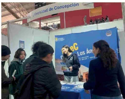
LAS CASAS DE ESTUDIOS superiores tienen la posibilidad de mostrar su oferta académica a los potenciales alumnos.

Así, quienes deseen ingresar en 2025 a centros de formación técnica, institutos profesionales o universidades, como aquellos que ya están cursando una carrera sin apoyos financieros, podrán completar el formulario en línea para optar a la gratuidad y a otros beneficios del Estado.