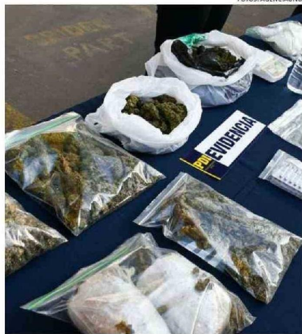
LA MARIHUANA ESTÁ ENTRE LAS SUSTANCIAS QUE MÁS CONSUMEN LOS JÓVENES EN EL PAÍS. EN LA REGIÓN TIENE NIVELES BAJOS.

que los videojuegos, la música y las redes sociales lo presentan como una opción de diversión, al igual que el consumo de alcohol. Es verdad que cuando salgo con mis amigos hacemos la previa y me tomo un 'copepe'. Hay bares que le venden a menores de edad o al amigo que es mayor de edad, pero sabiendo que vamos a tomar todos", dijo.