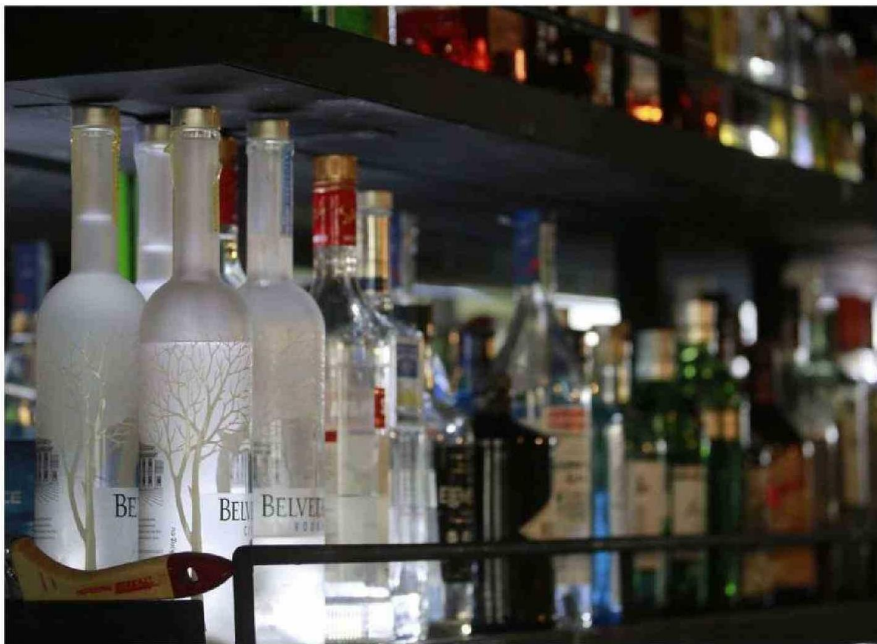
LOS INDICADORES DE ESCOLARES QUE HAN CONSUMIDO ALCOHOL HAN DESCENDIDO EN LA REGIÓN, PERO SIGUEN SIENDO UNA PREOCUPACIÓN.

"Cuando observamos el comportamiento respecto del consumo de sustancias y situaciones de riesgo, que son los dos grandes indicadores que permiten observar el tema de las prevalencias, hemos visto efectivamente un impacto en la región desde 2015 a la fecha, donde hay una tendencia a la disminución respecto al consumo de ciertas sustancias ilícitas (alcohol y marihuana). Esto es un aliento para ampliar y fortalecer el trabajo preventivo, más aún cuando vemos que existe un aumento en la percepción de riesgo, es decir, cuando la personas se dan cuenta de cuáles son los factores individuales, sociales, entre otros que favorecen la problemática del consumo de sustancias", explicó la directora.