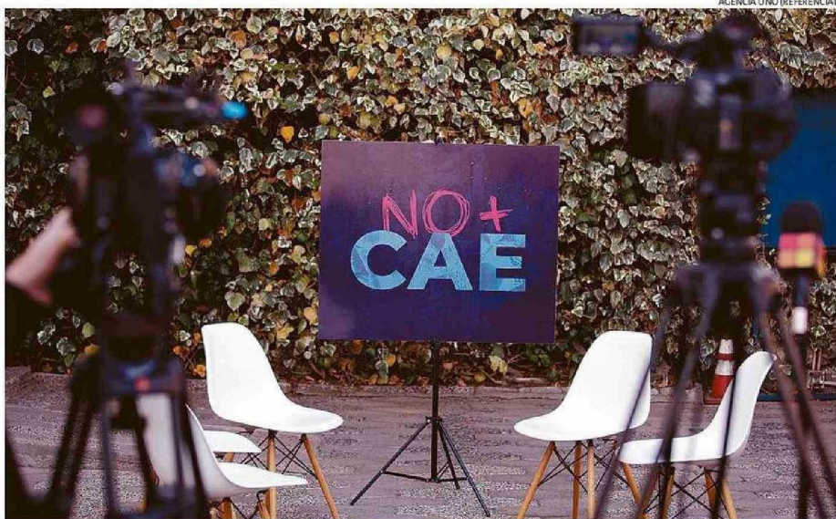
DESDE QUE SE CREÓ EL CRÉDITO CON AVAL DEL ESTADO, MÁS DE 1.200.000 PERSONAS, A NIVEL NACIONAL, SE HAN VISTO BENEFICIADAS.