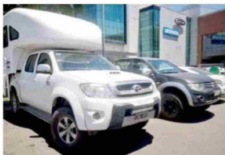
En las diversas calles y en los centros comerciales de la Región del Maule se pueden apreciar varios vehículos con patentes argentinas..