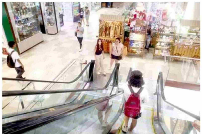
En el Mall Plaza Maule, en el sector oriente de Talca, se ve a diario la presencia de muchos turistas argentinos.

Las principales adquisiciones de los transandinos son televisores, teléfonos celulares, ropa deportiva, electrodomésticos y neumáticos. A muchos argentinos se les ve pasear por el Mall Plaza Maule, ubicado en el sector oriente de Talca. En tanto, el talquino Manuel