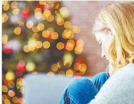
BRINDAR COMPAÑÍA A QUIEN VIVE UN DUELO POR ESTAS FECHAS.