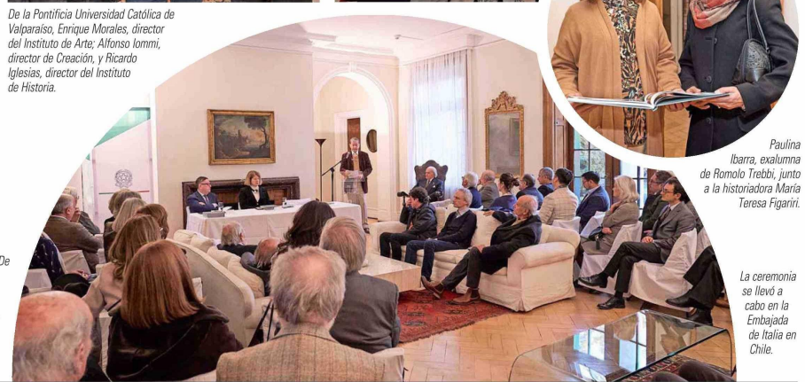
La ceremonia se llevó a cabo en la Embajada de Italia en Chile.