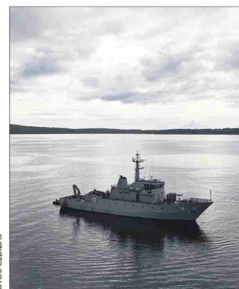
Coordinado desde Chiloé, el Buque Cirujano Videla recorre el extremo austral para brindar atención médica a la población.