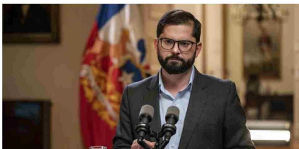
El Presidente Boric visitará Punta Arenas, San Gregorio, Primavera y Porvenir, donde abordará temas de conectividad, obras públicas y cultura.

El presidente Gabriel Boric inicia mañana una gira por Magallanes, la cual se extenderá hasta el viernes.